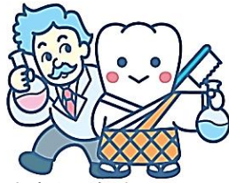
日本歯科医師会PRキャラクター よ坊さん（福島県 Ver.）